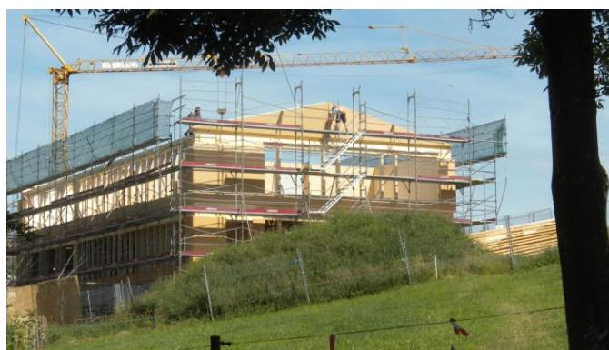
Bau- und Montagephasen