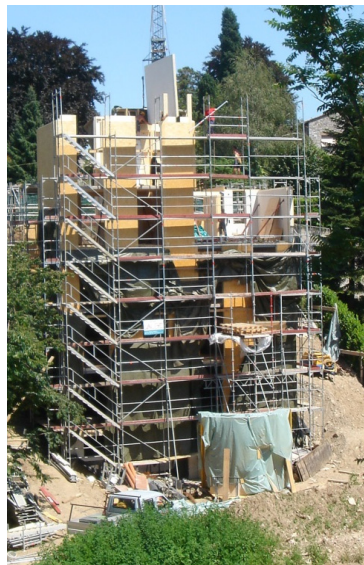
Bau und Montagephasen